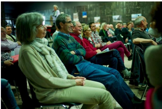
« Moment privilégié de partage et de souffle »