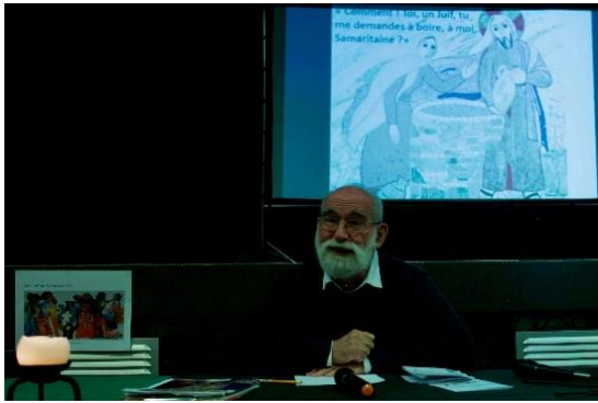
« Comment toi, un juif, tu me demandes à boire, à moi, Samaritaine ? » Jean 4