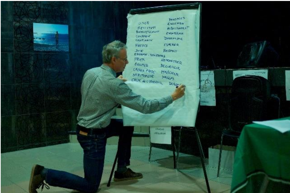
Avec une large majorité de non cvx, nous avons aussi pu partager quelque chose de notre trésor ignatien.